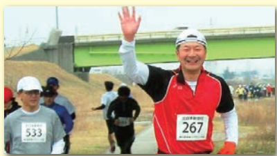
3月に神通川マラソン大会に参加、景色を楽しみながら無事完走しました。