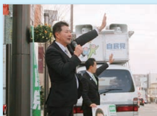
自由民主党富山市連遊説局チームのメンバーです。月曜は朝、掛尾交差点（たまに駅北）、土曜は昼にグランドプザ前にて街頭遊説してます。