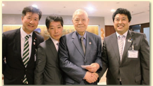
台湾の李登輝元総統から日本に期待する熱い勉強会に参加。