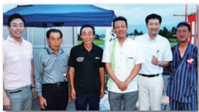
地元で各町内会の納涼祭に呼んでいただきました。