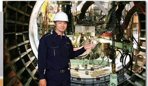
松川貯留管施設（2万トン）建設工事現場を視察。浸水被害軽減のため中心市街地の地下で進められています。