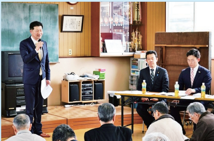
市政報告会を定期的に行っています。