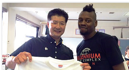
藤ノ木中学校特別授業にプロダンサーのテリーライト氏が講師です。