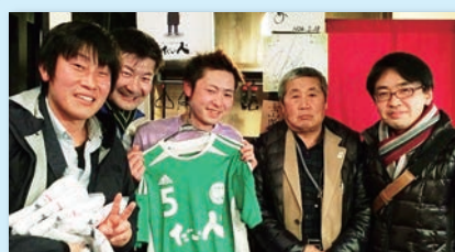
常願寺川公園SCの役員の皆さんと支援企業のマスターです。