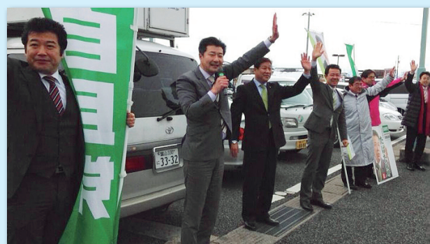
地域の皆さんに私たちの考えを直接聞いてもらう機会として活動中。