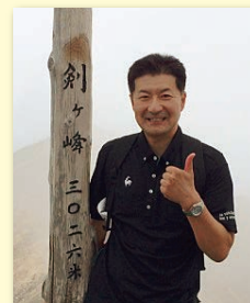
豊平ターミナルから剣ヶ峰頂上まで90分で到着