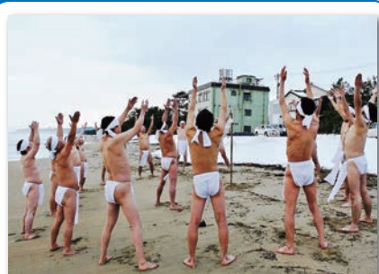
自身の鍛練のため極寒の2月に寒中褌を行いました。