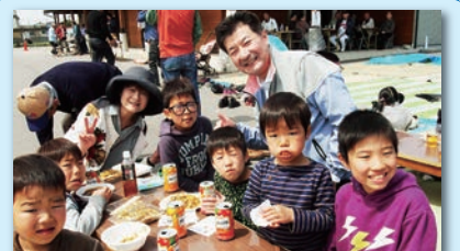
花見バーベキューでは多くの子供たちの参加で盛り上がりました。