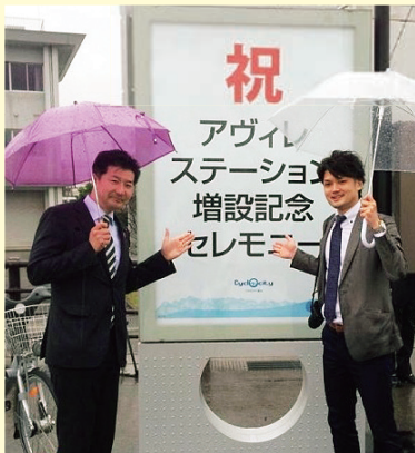
環水公園西に増設されました。