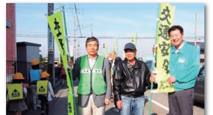
交通安全の啓発の為、藤ノ木校下「人波作戦」に参加。