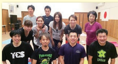
毎月第1・3木曜日19時半より中部コミュニティセンターで、楽しくコアトレしています。