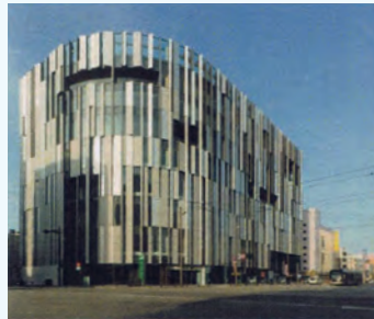
西町南地区 「TOYAMA キラリ」 (H27.8 既開業)