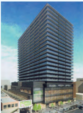
総曲輪三丁目地区 (旧富山西武) (H31 完成予定)