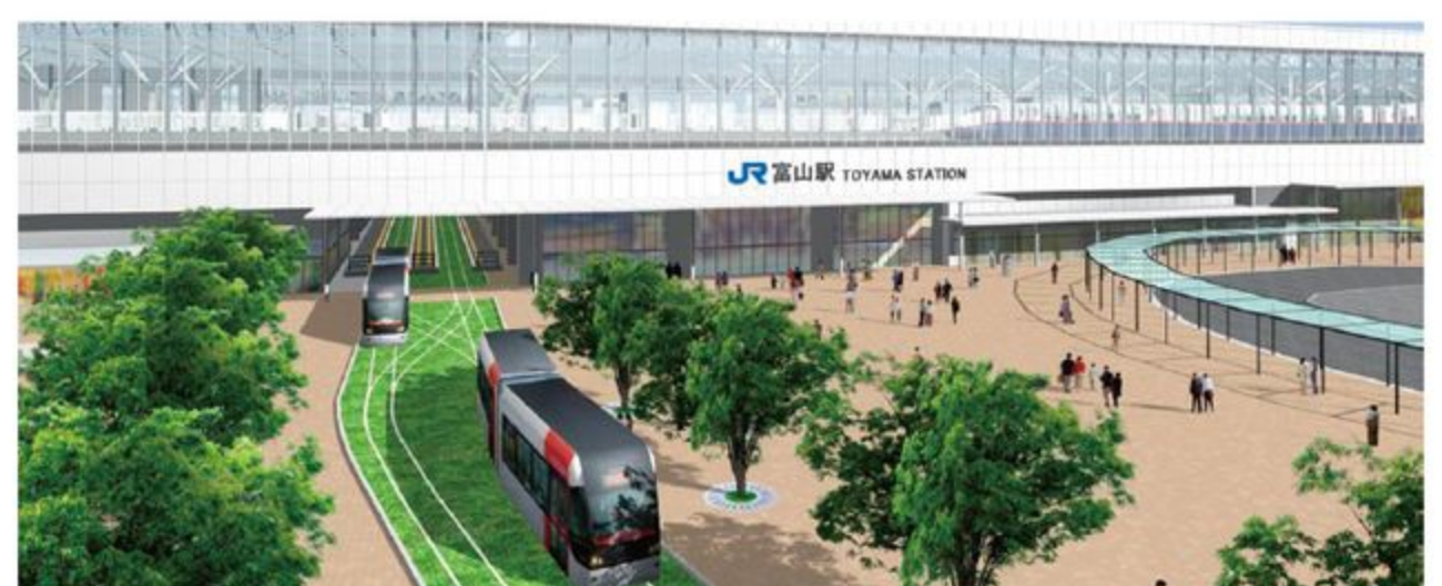
新幹線駅舎(富山駅南口)