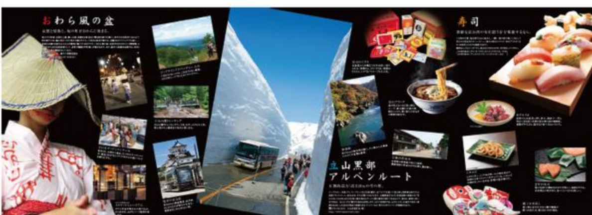
富山市観光パンフレット