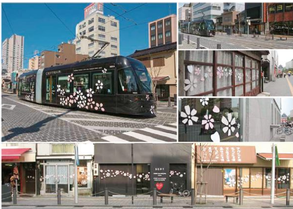
桜のラッピング車両と街並みタッピング

答 商工労働部長 旅行ニーズが多様化するとともに、パソコンやスマートフォンなどを活用して観光地などの情報を取得する旅行者が増加しており、モバイル端末対応した環境整備を行う必要があると考え、今年度、宿泊施設が行うWi-Fi設備の導入に対する補助メニューを創設した。さらに、昨年度改訂した観光実践プランにおいて、旅行者向けモバイルサイトを拡充することとしており、今後、市内外の観光情報や交通情報などの提供を行い、魅力ある観光のまちづくりを目指してまいりたい。