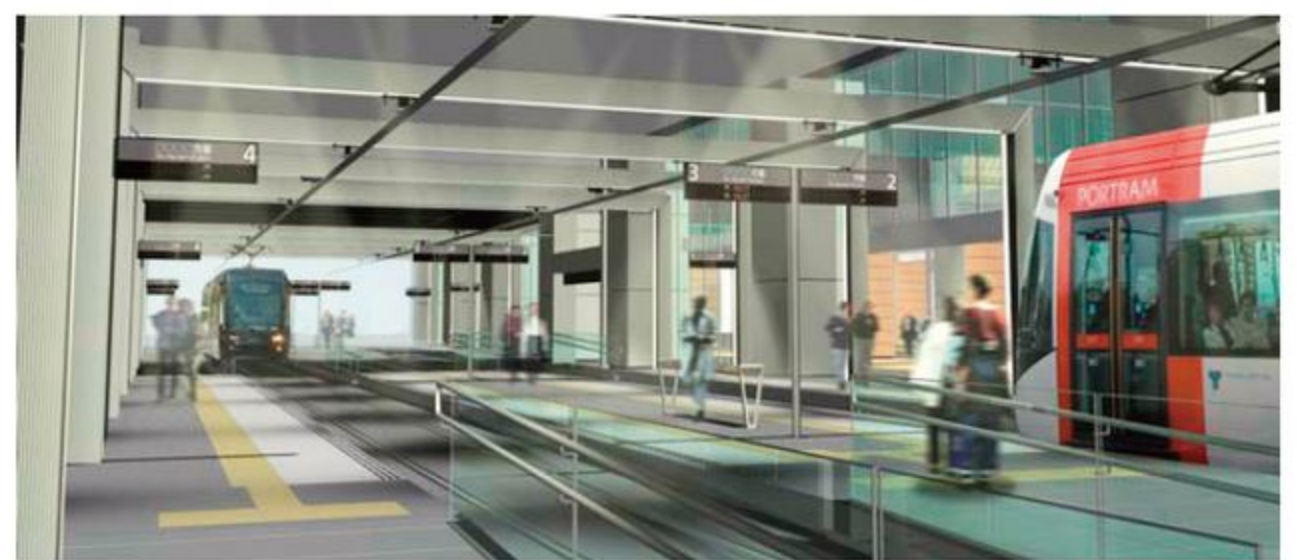
軌道空間イメージ(高架下電停)

答 市長 多くの観光客やビジネス客が訪れる平成26年度末の北陸新幹線開業にむけて、富山駅周辺の適切な場所での喫煙所の設置に向けて検討してまいります。